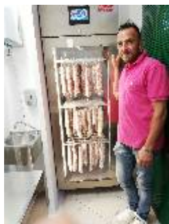
Boucher et propriétaire LA BOTTEGA DEL MAIALE - Italie -

Vous n'aurez plus à déplacer les saucisses à l'intérieur du cabinet avec des avantages évidents dans l'organisation du travail.