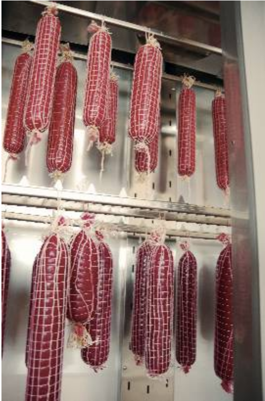
Affinage de saucisse végétane avec KLIMA AGING