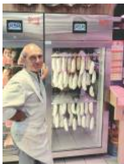
Boucherie Rémy, Grenoble - France -

"... Je pense que définir KLIMA AGING seulement comme un affineur est un euphémisme. Depuis que j'ai placé cet armoire à l'entrée de ma boucherie, mes ventes ont augmenté. Maintenant, je peux partager toutes les phases de l'affinage avec le public, ce qui augmente ma transparence et encourage le client à en acheter ... toutes les saucissons séchés sont réservées avant même qu'elles soient prêtes! ..."