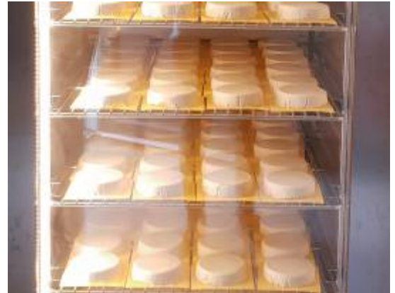
Vieillissement des Fromages végane avec KLIMA AGING

C'est pour ça que vous avez besoin d'une machine professionnelle pour les fromages végétaliens et les charcuteries , capable de sécuriser l'utilisateur, qui peut ainsi contrôler toutes les étapes du processus de vieillissement à l'aide de programmes spécialement créés avec des icônes dédiées .