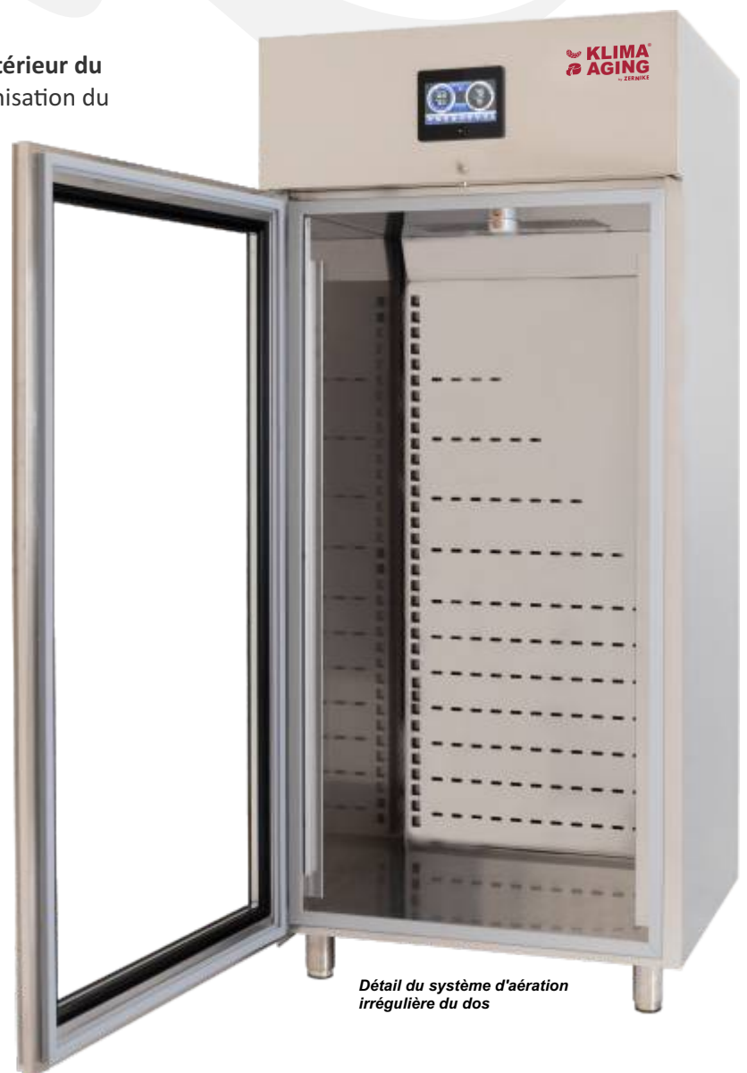
Détail du système d'aération irrégulière du dos

"... Avec Klima Aging, je peux affiner et vendre de la charcuterie toute l'année, ce qui résout le problème de la saisonnalité ..."