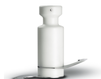
Lama per impasti