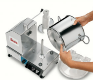
Vasca inox 18/10 con fondo termodiffusore facile da svuotare e da pulire